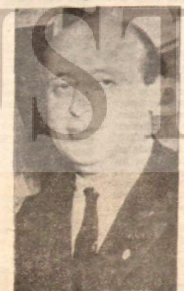
Süleyman Demirel Ağız değiştirdi

Petrolün yabancı tasallutundan kurtarılması yolunda kamu oyunun gösterdiği güçlü tepki, A.P. saflarında bozgun yarattı. Daha