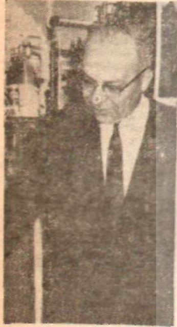
Necdet Egeran Mobil'e dönmesin?..

Türkiyedeki Masonlar, geçenlerde sessiz sedasız yeni bir Masrıkı Azam seçtiler. Pek az üyenin katılımıyla yapılan seçim, ucu A.P. Genel Başkanına kadar uzandı. İleri sürülen manevraların da etkisiyle ço sürprizli sonuçlandı. Demirel'e AP kongresinde mason olmadığını söyleme imkânını ve-