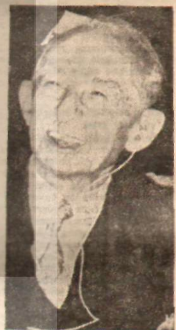
CHP İderi İnönü «Asgariyi istiyoruz»

Petrolden dışarıya transfer edilecek para, Orta Doğu ülkelerinin