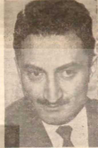
Bülent Ecevit «Amerika'ya tanınınız!»

Ecevit'in bu sözlerini, Amerikada fazla Amerikacı çevreler, eğer yürüklerinde hâlâ biraz memleket sevgisi kalmışsa, ibretle okunmalıdır.