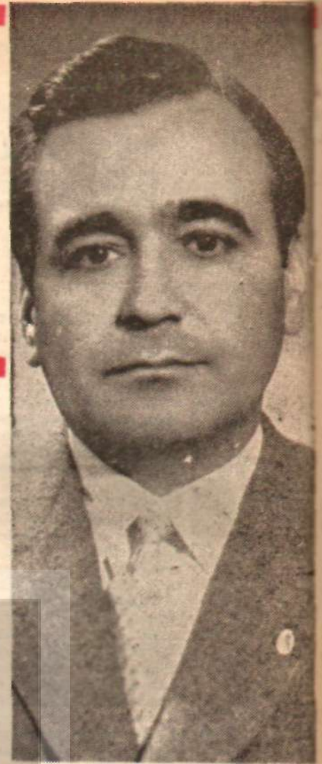
Mehmet Turgut Enerji ve Tabii Kaynaklar Bakanı

Mehmet Turgut bu hükmü savunanın daha kurnazca hareket etmektedir. Bir taraftan TP'nin böyle bir ihtiyacı duymadığını yani hükmün tatbikatta bir sakınca yaratmadığını, diğer taraftan da böyle bir ihtiyaç duyulursa kanunun başka ruhsatname alınmasına müsait olduğu zehabını yaratma peşindedir. Enerji Bakanı, T.B. M.M. İktisadî Devlet Teşekküllerini Denetleme Karma Komisyonunda, Alt Komis-