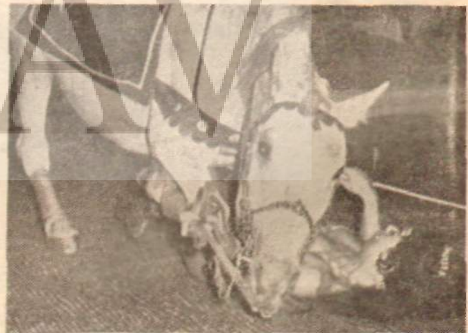
Mutlu azınlık için ath - soyunmalı eğlence Para devletten çıkıyor!..

Bu ufak örneklerin gösterdiği gibi, devlet turizmi geliştirme gerekçesiyle, bir mutlu azınlığın zevk ve eğlencesi için dar gelirli mükelleflerin paralarını zenginler yararına israf etmektedir. Hiç değilse otel ve gazinoculuk alanında özel teşebbüsçülük yapalım ve devlet kurumlarının parasıyla «otel, gazino kurmaktan ve işletmecilik yapmaktan vazgeçelim.