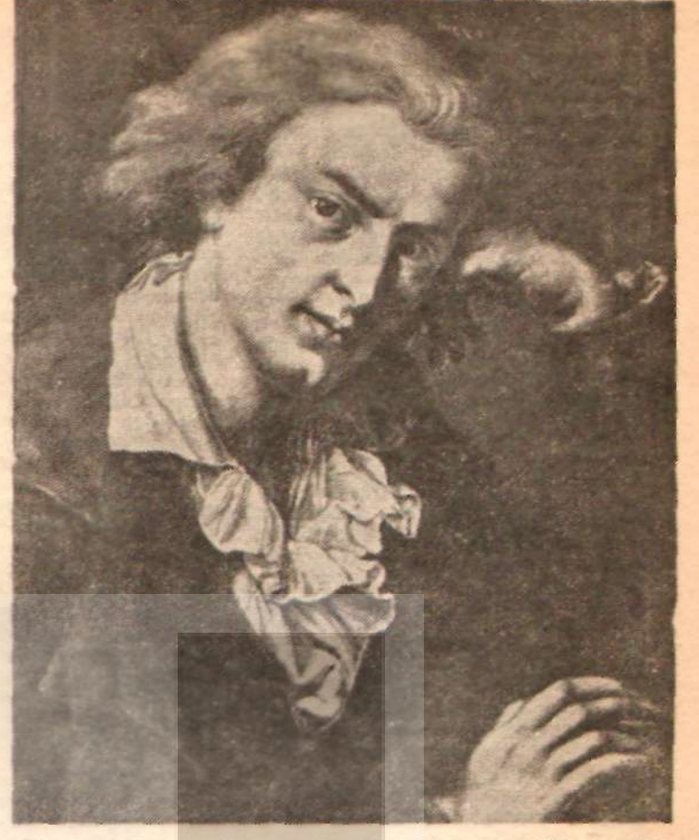
Dünya yazarları toplantısının yapıldığı iki kentten biri olan Weimar'ın Alman kültür tarihindeki önemli yeri, Goethe ve Schiller'i yetiştirmesindedir. Yukarıda Schiller'in bir portresi görülmüyor

İtfah edelim ki Nazilerin bizim kitaplarımızı yakmaları, yıl-